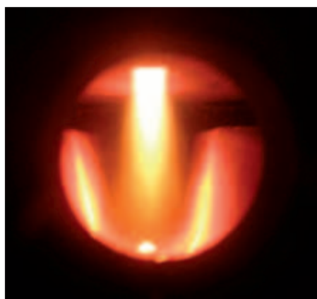
Splyňovacia technika u Vitoligno 100-S

Regulácia Ecotronic 100 presvedčí svojou jednoduchou a intuitívnou obsluhou. Na podsvietenom displeji sa všetky informácie zobrazujú pomocou symbolov. Stĺpcová grafika informuje o aktuálnom stave nahriatia.