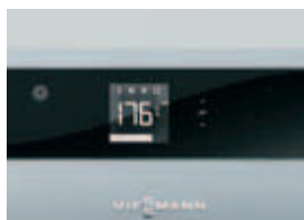
Regulácia Ecotronic 100 s osvetleným displejom pre jedno- dúchú a intuitívnu obsluhu

Vitoligno 100-S je kompaktný, cenovo atraktívny splyňovací kotol na kusové drevo, ktorý sa hodí na monovalentnú ako aj na bivalentnú prevádzku (doplnenie plynového vykurovacieho zariadenia).