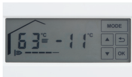
Podsvietený dotykový LCD-displej

Plynové nástenné kondenzačné kotly Vitodens 100-W a Vitodens 111-W sú ovládané cez nový dotykový LCD-displej s podsvietením. Displej je dobre čitateľný aj v tmavom prostredí a umožňuje komfortnú obsluhu.