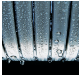
Účinný výmenník tepla Inox-Radial s dlhou životnosťou

5 rokov záruka na kondenzačné kotly do 35 kW