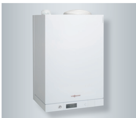
Vitodens 111-W s integrovaným nabíjacím zásobníkom z ušľachtilej nehrdzavejúcej ocele s objemom 46 litrov